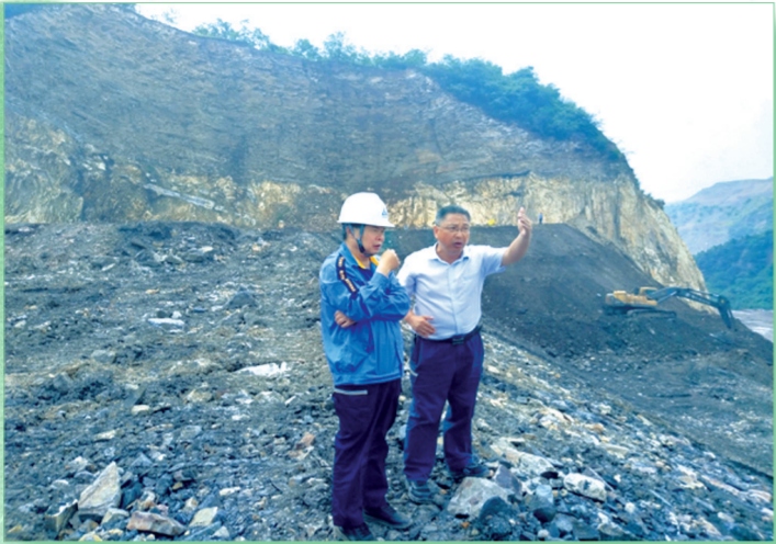
中铝矿业有限公司领导现场督导