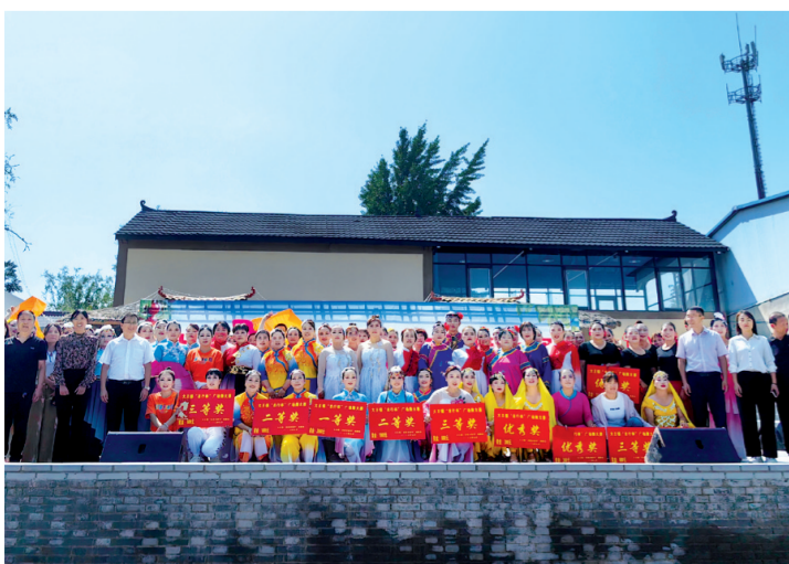
广场舞大赛选手合影