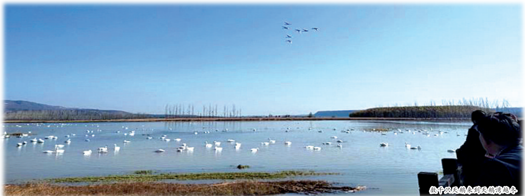
数千只天鹅来到民鹤湾越冬