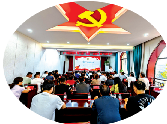
“五星”支部大比武活动

学亮点补短板,扬优势促发展,该镇持续深化农村人居环境集中整治,扎实推进美丽乡村建设,镇区行政街、S310国道重点路段栽植景观月季500余株,栽植景观红枫20余棵,栽植景观黄杨500余棵,在镇区东、西人口显著位置树立标识牌,打造微景观;人居环境集中整治有效推进,累计打造“五园”1465个、“微景观”130余处,栽种各类绿化苗木21万余株,树立标志性村牌24个,美化墙体1.2万余平方米,评选五美庭院689个;全力打造“四美”公路。在S312沿线栽种百日红、红叶石楠等苗木1500余棵,同时与“村务员”相结合,确保重点路段有人清理、有人养护、有人绿化。