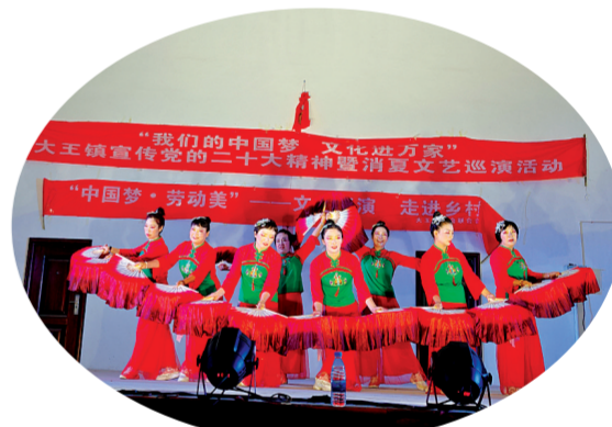
宣传党的二十大精神暨消夏文艺巡演活动现场

创新“资源整合、村企结合、三产融合、农户联合”的“四合模式”,持续推进特色产业向更深领域、更高层次发展上做文章,以建链强链延链为导向,助推产业发展提质增效,以产业引领激发乡村振兴强劲动能。积极申报全球农业文化遗产,川坝古枣林正在积极申报全球重要农业文化遗产;加强村企合作,大王村的阳光玫瑰葡萄数字农业创新园、同家坪村现代渔业产业园、后地村百亩林枣酒产业园等村企结合亮点突出;做大做强主导产业,成立大枣协会、蔬菜协会,加强与河南中药材协会、三门峡社会管理职业学院等协会和院校合作;新兴产业不断涌现,王和、韩家村栽植早油桃7000余亩,早油蟠桃2000余亩,韩家村建设百万袋食用菌产业园,佛湾蟠枣产业园、贺村千亩红梨等产业项目建成投产。