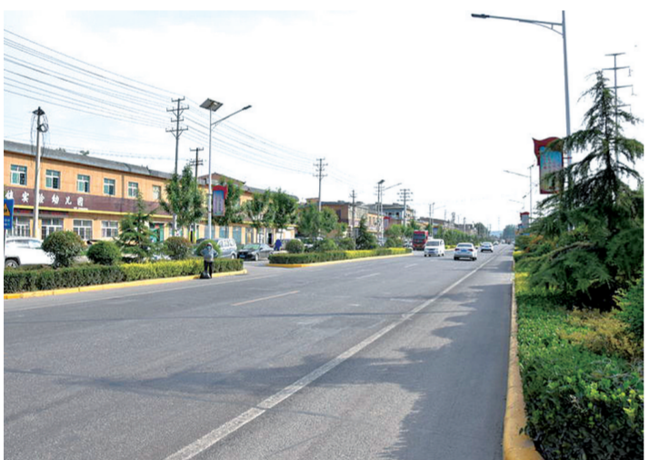
镇区干净整洁的街道

深耕不辍、狠抓落实,奋力推动全镇工作再上新台阶。拼项目,全年共谋划项目21个,计划总投资41.7亿元,新签约项目12个,新开工项目22个,新投产项目8个,完成固定资产投资12.4亿元;拼招商,大员招商23次,外出招商28次,邀请客商考察洽谈26家,签约企业6家;拼企业,培育新增规模以上工业企业3家,新增市场主体566家;拼消费,开展助农消费、夜间经济消费、文化旅游消费等为群众增收40余万元;拼外贸,四季丰果蔬的阳光玫瑰葡萄出口至马来西亚、印度尼西亚等国,出口额3000余万元,实现外贸“破零新增”;拼创新,积极申报高新技术企业1家、科技创新平台1家;拼产业,围绕大枣、蔬菜、水产养殖等特色,加快推进项目建设;拼环境,首席服务员全年累计入企72次,解决实际问题24处;拼速度,移民小区、好阳河综合治理、后地村乡村振兴示范村创建等项目均顺利推进。