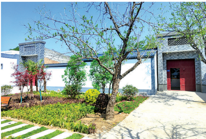
乡村建设风景如画