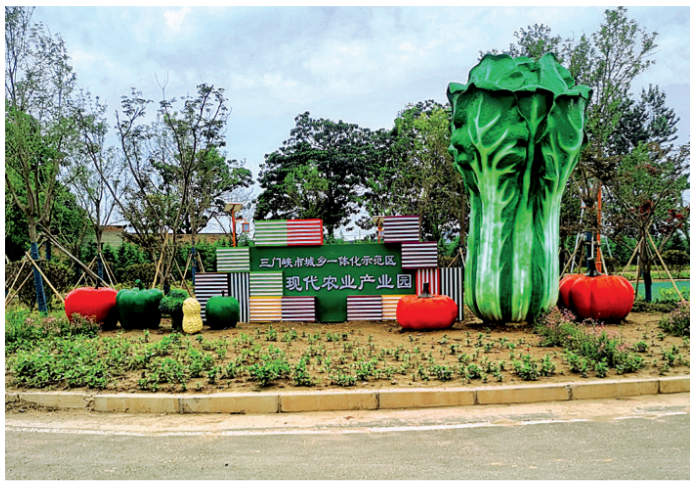
大王村现代农业产业园