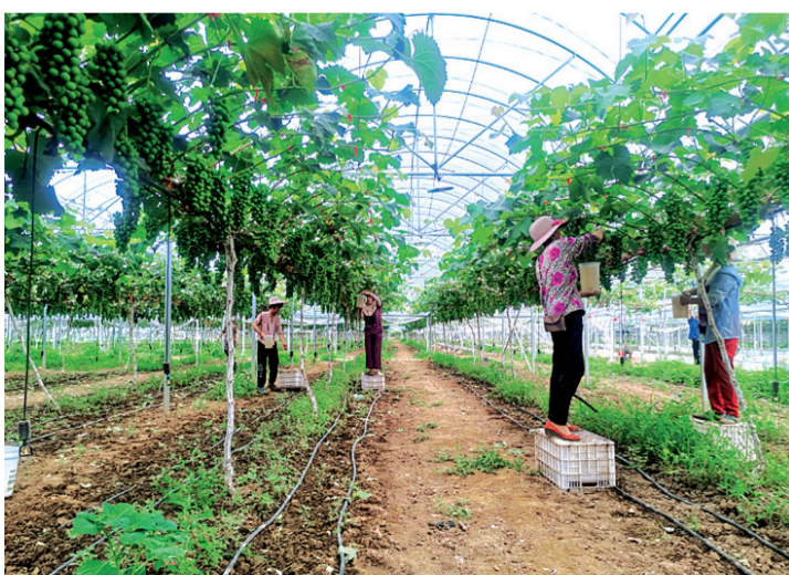
村民在阳光玫瑰葡萄产业园劳作

基层组织强,事业日日新。2023年以来,该镇坚持以党的政治建设为统领,抓基层、打基础,补短板、固优势,基层党建工作蓬勃发展。开展主题教育专题党课41次,组织党员干部集中学习849人次,研讨交流124次,举办各类培训13次,外出实践学习7次,各党支部检视查摆问题121个,制定整改措施136条;创建“五星”支部1个、“四星”支部3个、“三星”支部9个,开展“五星”支部创建、“五星”大比武活动2次,实现“五星”支部不断涌现、“四星”支部增加、“三星”支部连片的新局面;组织逐村观摩3次,累计评选基层党建、产业发展、生态宜居、平安法治、文明幸福“红旗”45面;深入推进“三化”建设,开展专项整治活动9次,发布节前廉政提醒6次,力促广大干部在理论上有所提升、能力上有所突破,筑牢信仰之基,把稳思想之舵。