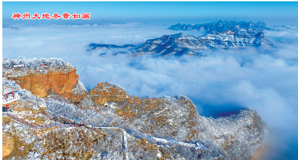
神州大地冬景如画

公报还显示,我国老龄事业在医养结合方面得到深入发展。截至2022年末,全国共有两证齐全(具备医疗卫生机构资质,并进行养老机构备案)的医养结合机构6986家,比上年增长7.6%;医疗卫生机构与养老服务机构建立签约合作关系8.4万对,比上年增长6.7%。