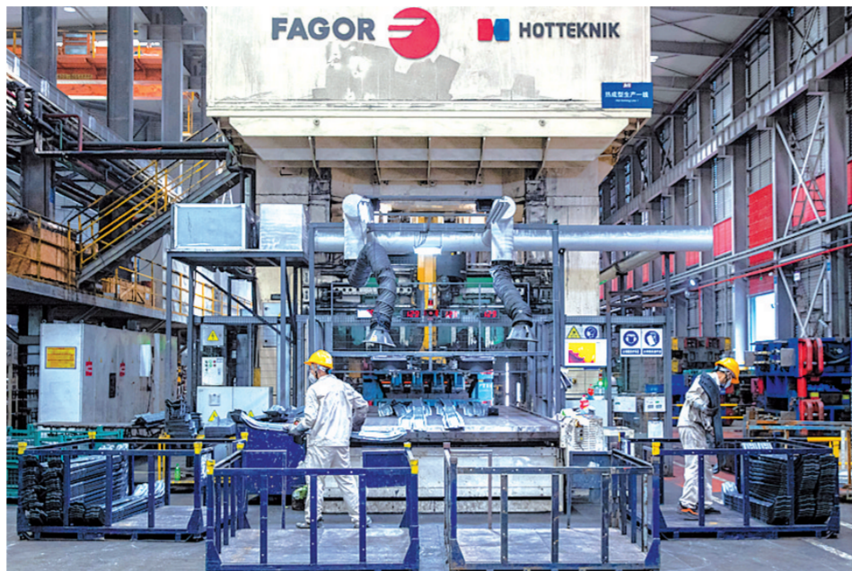
在位于重庆市两江新区的一家机械设备生产企业的热压车间，工人将刚下线的零件装箱(2023年7月16日摄)。