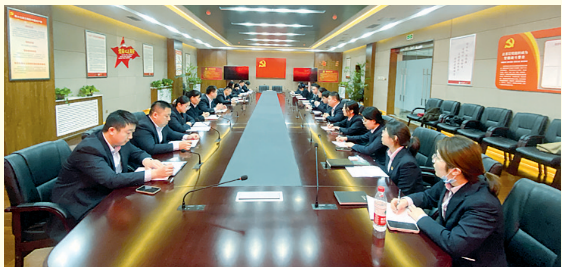
中国银行三门峡分行高度重视，合理组织专题学习，持续推动主题教育走深走实。图为近日，该行团委组织青年员工召开主题教育座谈会，青年员工分别从理论学习、工作收获、问题反思、未来发展等方面畅谈奋斗之志、展望未来目标，现场气氛热烈活跃。

收紧“作风+”保持监督高压。统筹抓好管理改进和作风锤炼，对标中央八项规定精神、“过紧日子”要求和人民银行制度多轮次开展专项治理、专题自查和专项检查，整合纪检、内审等监督力量持续监督“过紧日子”举措落实情况、督导问题整改，推动作风转变和执行规范提升。(曹慧译)