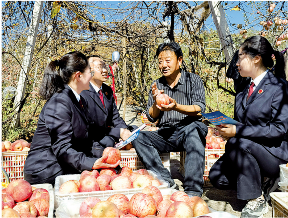
眼下正值苹果丰收季，10月30日，灵宝市检察院组织干警来到寺河乡，就购销合同签订、防范电信诈骗等方面向群众开展普法宣传，帮助群众守好“钱袋子”。